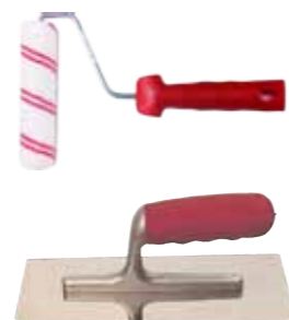
Rodillo y Llana Estucador Roller and trowel