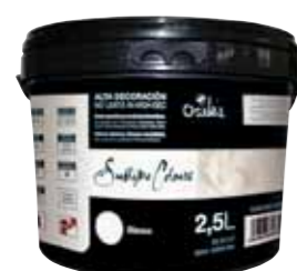
Sublime Colours 2,5L (10-12m 2 /L)