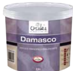
Damasco 2,5L (6-8m 2 /L)